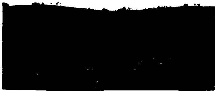
丸加山(286x71v)に広がる高原。アスエも見事でした。