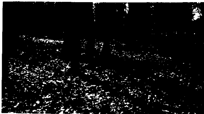
カタクリ咲く 丸山公園 石ハシに石群が見える

私は4月27日深川市の丸山(1194m)の カタクリを友人と行って来ました。今年の カタクリのピークは4月22日～25日との事 を以て私達が行った日は三分は遅れ 色もあせていましたがそれなりの群落が 山の斜面一帯に咲いてました。又今年も 様子が咲いていて、頂上で花見をしている人達が 何組もいました。私達も残雪の山並を見ながら 花見をしてきました。 平岡武津