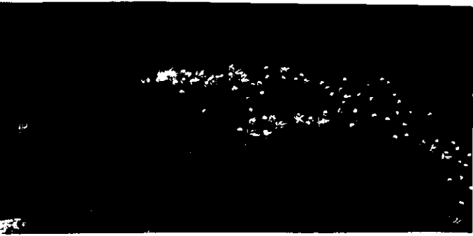
沼の岸の縁にケグルスが紅葉して……。