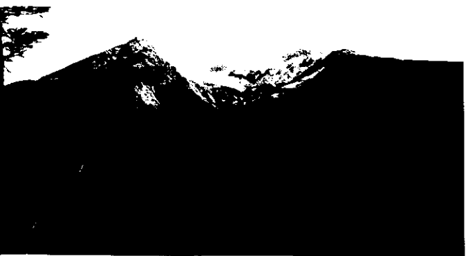
鑿井ヶ原湿原の紅葉と……登別岳と氷山岳の紅葉も見事でした。

会報(はくとみれ)に載せる原稿を募集しています。 思い出の写真や今年登った山など各種の文章を歓迎し、 是非ご協力をお願いします。会報担当 平岡。